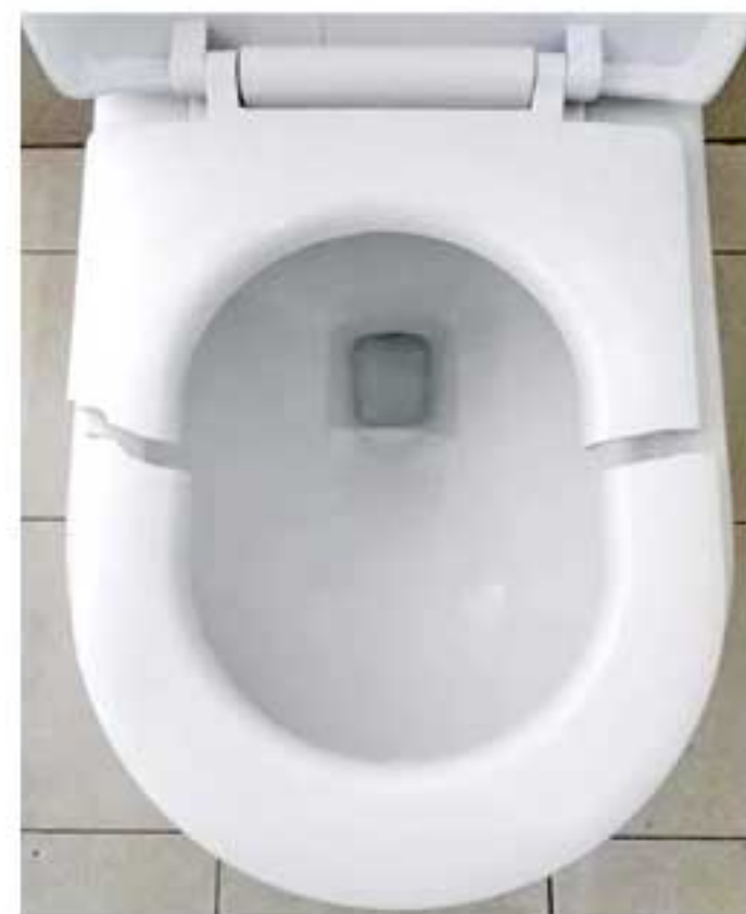
(二楼公共区域卫生间内被踩断的马桶盖)