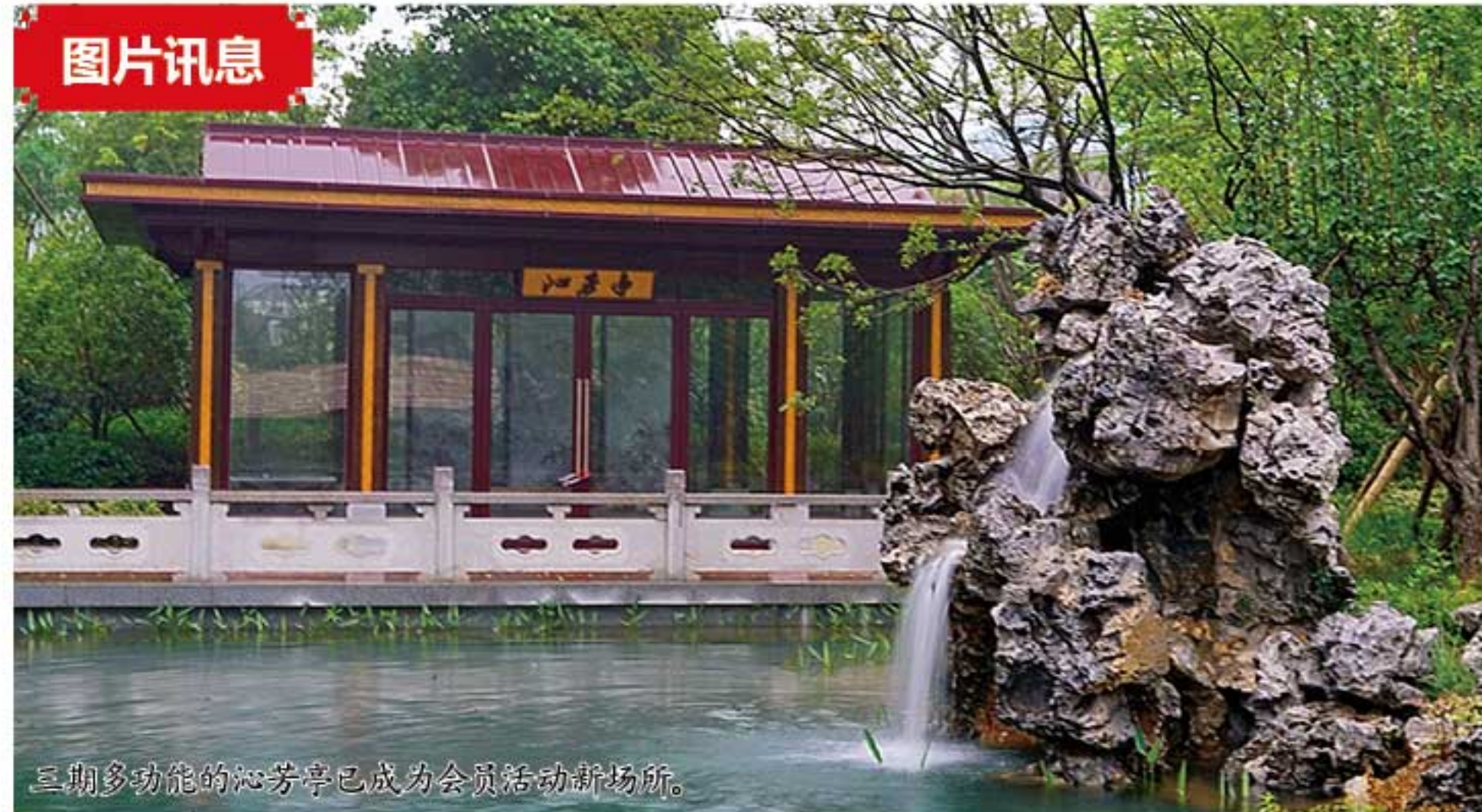
三期多功能的沁芳亭已成为会员活动新场所。