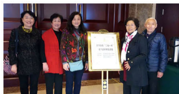
图为参赛选手、志愿者与常州市桥协领导合影留念

红入桃花嫩，青归柳叶新。入春的常州，繁花似锦绿草如茵。4月2日18支桥牌队的100多名桥友喜聚美丽的西太湖畔，参加由中共常州市委老干部局主办、常州市老干部活动中心和常州市桥牌协会承办的华东二省一市老干部桥牌邀请赛。