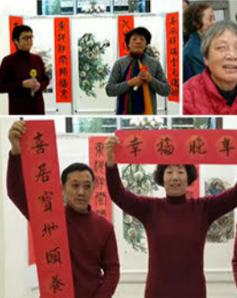
八号楼丙丁单元举办“楼栋春晚”