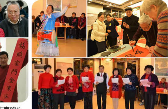
一号楼迎新会春意盎然