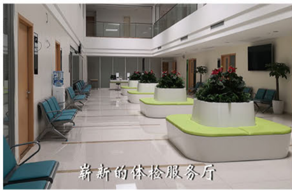
崭新的体检服务厅

金东方健康体检中心技术力量雄厚,设备先进、环境优雅、我们将以“关注健康每一天”为宗旨,坚持严格的质量标准,细致周到的检查,求真务实的作风和耐心热情的服务为每一位来宾服务。(朱建华)