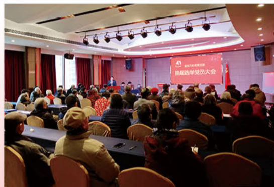
上一届支部委员会工作报告