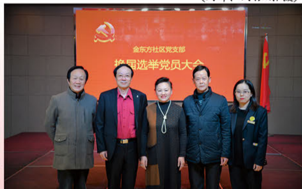
新一届支部委员会