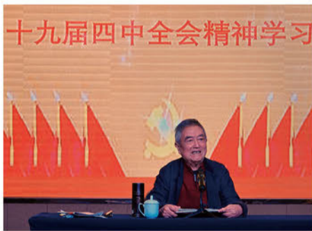
十九届四中全会精神学习

本报讯 2019年11月20日，常州工业职业技术学院党委和支部及金东方社区党支部，在金东方多功能厅联合开展了《学习党的十九届四中全会精神》的主题党日活动。