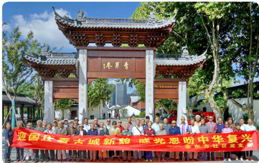
金东方9月份党员活动日，社区党总支组织党员参观常州青果巷。迎国庆看古城新貌，感党恩盼中华复兴。