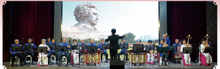
民乐合奏《红太阳颂》