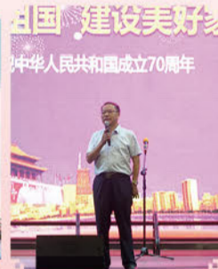
模仿秀《熟悉的声音》