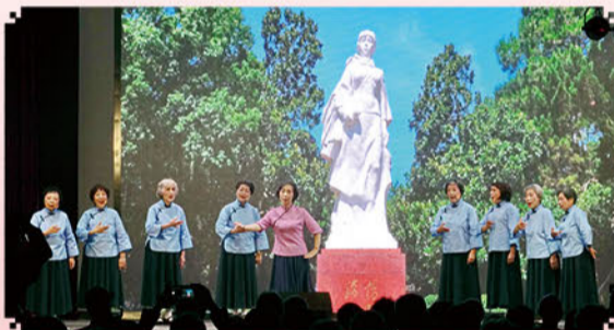
越剧《杨开慧》选段“忠魂曲”