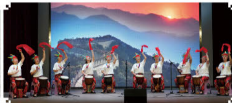
非洲鼓表演《爱我中华》