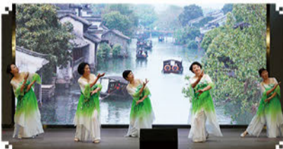
配乐朗诵《变老的时候会更好》