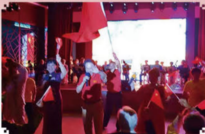
序幕快闪《我的祖国》《红旗飘飘》等