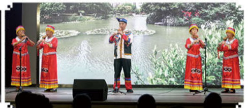
葫芦丝齐奏《有一个美丽的地方》