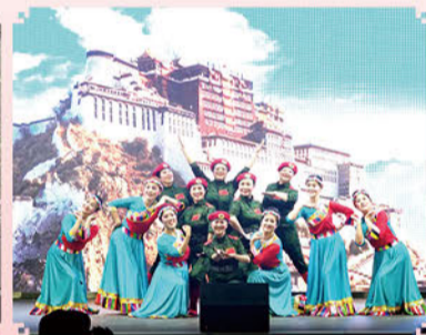
舞蹈《毛主席的光辉》