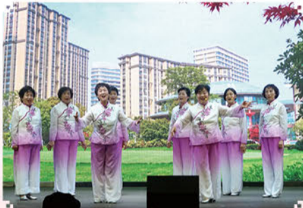
锡剧表演唱《共同建设美好家园》