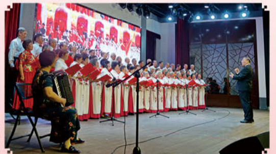
大合唱《我们走在大路上》等